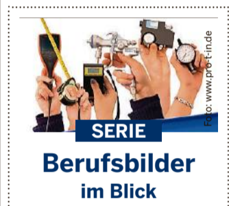
SERIE Berufsbilder im Blick