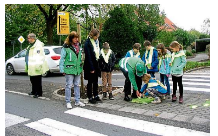
Beim Aufmalen der gelben Füße am Zebrastrifen Frankfurter Straße